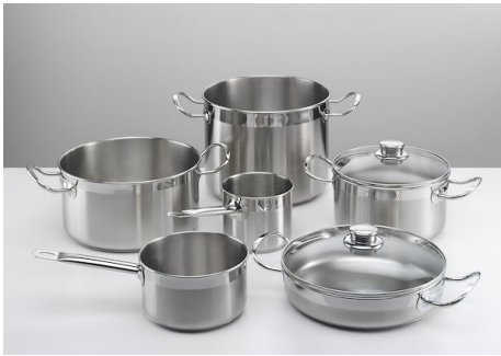
Batteria pentole Induction PRO 8pz. 8210 008